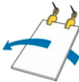
Vertical lifting of steel structures / Izaje vertical de estructuras de acero