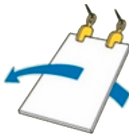
Vertical lifting of steel structures / Izaje vertical de estructuras de acero